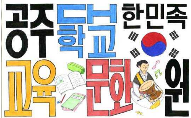
한글 스케치 대회