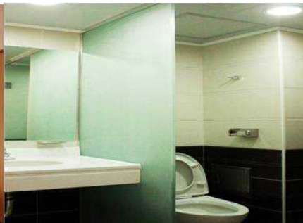
기숙사 생활실 욕실